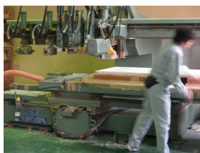
1/100 ミリ制御の加工機

本体を組み上げた後に、寸法カット、丁番の切り欠ぎ、レバーハンドルや引き手、さらに引き戸の戸車加工を工場でおこないます。機械加工するので 精度は1/100ミリ 。しかも刃物の研磨を徹底しているので切れがよくきれいな仕上がりになります。その後に金具の取り付けもして出荷します。同じ加工は一度入力したプログラムを呼び出して作業できるので効率はよく、稼動中には次の作業の準備ができて無駄がありません。